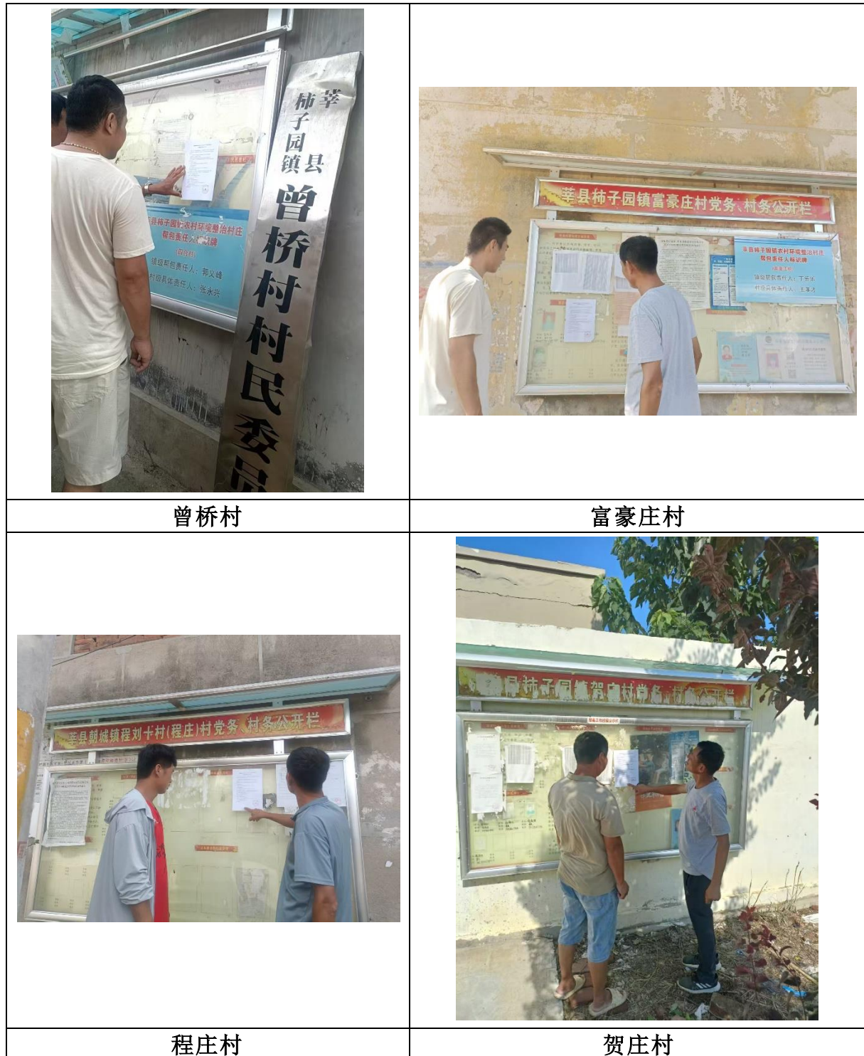
图 3.2-4 第二次信息公示村庄张贴照片