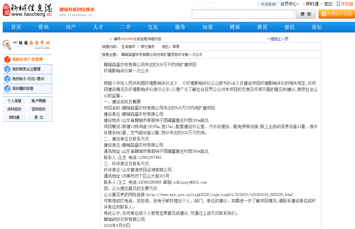
图 2.2-1 第一次环境影响评价信息网络公开截图