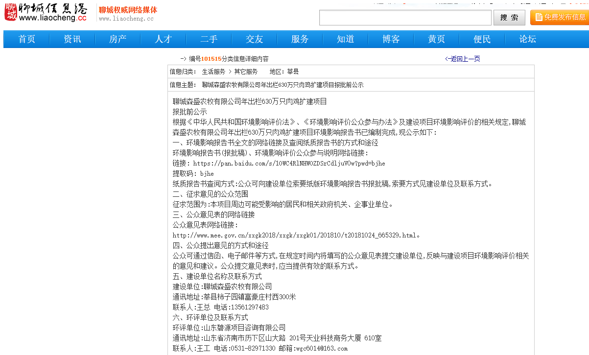
图 6.2-1 报批前公示网络公示截图