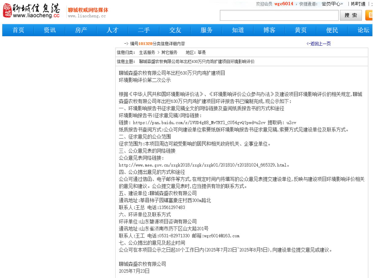
图 3.2-1 第二次环境影响评价信息网络公开截图