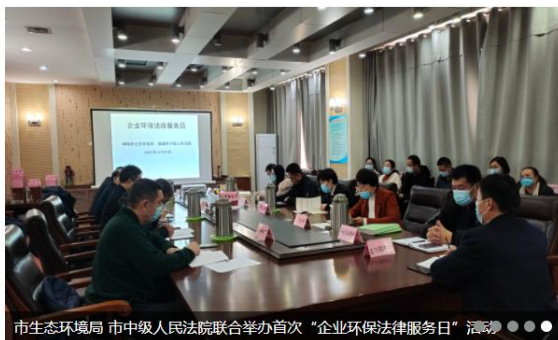
市生态环境局 市中级人民法院联合举办首次“企业环保法律服务日”活动